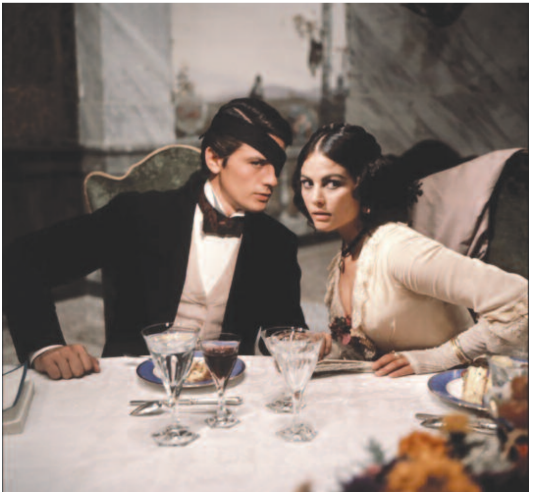
Alain Delon és Claudia Cardinale Luchino Visconti herceg A párduc című, 1963-as filmjében