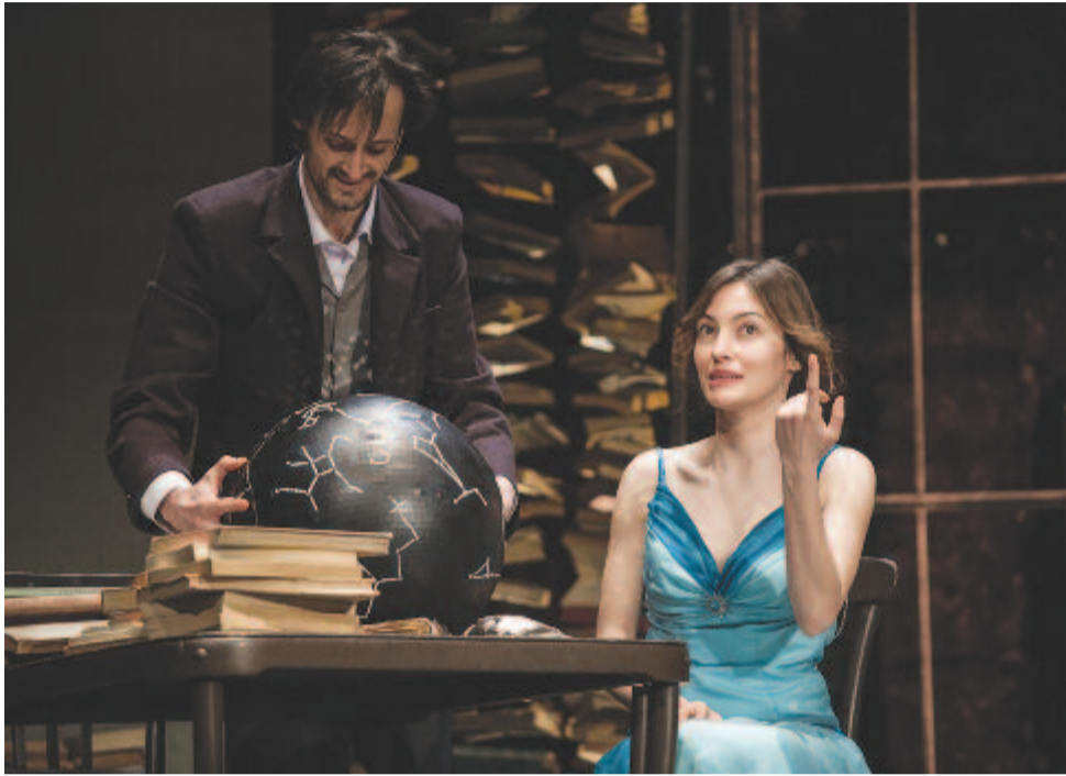
A névtelen csillag