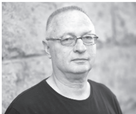
Spiró György író

A színház az írástudatlanoké, a belőle származó film is az, így az elképzelhető legin-